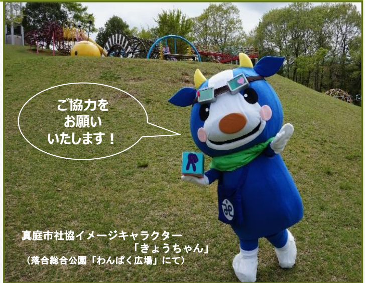
真庭市社協イメージキャラクター 「きょうちゃん」 (落合総合公園「わんぱく広場」にて)

令和2年度は、市内の個人・法人に会員としてご協力いただいた会費14,052,000円と、ふるさと会費111,000円を合わせ、総額14,163,000円を地域福祉活動に活用させていただきました。