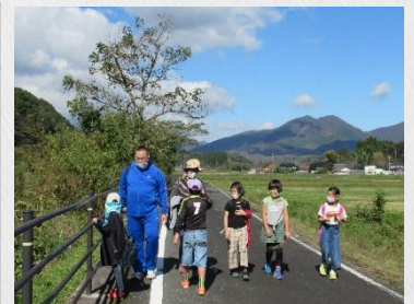
↑ 地区社協活動 (世代間交流ウォーキング)