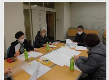
↑ 地域助けあい事業 (助けあい見守り会議)