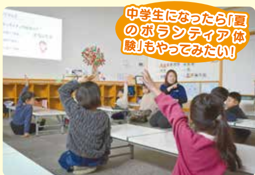
中学生になったら「夏のボランティア体験」もやってみたい！

児童クラブでボランティア講座開催。「ボランティア」や「身近にできるボランティア」を学んだよ！（北房）