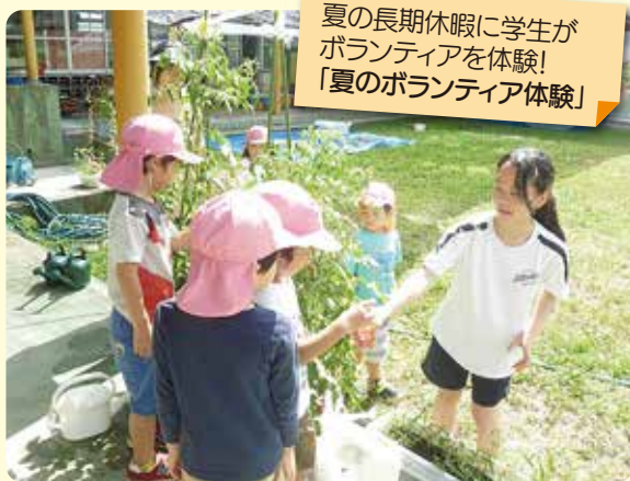
夏の長期休暇に学生がボランティアを体験！ 「夏のボランティア体験」

社会福祉協議会には、「ボランティア・市民活動センター」があり、ボランティア活動に参加したい人と、ボランティアの支援を必要としている人をつなげます。また、活動のきっかけづくり、活動に必要な知識や技術を学ぶ講座や研修会の開催なども行っています。センターの活動を紹介します。