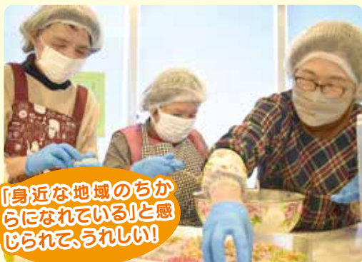
「身近な地域のちかになれている」と感じられて、うれしい！

生活に困りごとを抱えている世帯へ食の支援のボランティア（生活相談・寄り添い支援事業「おいでえ」）