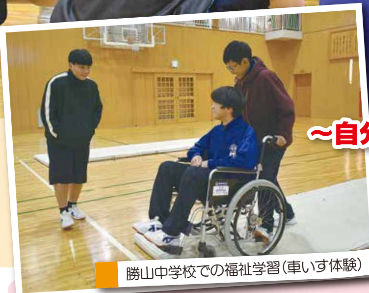
勝山中学校での福祉学習(車いす体験)