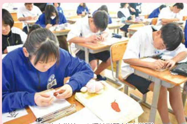
勝山中学校での福祉学習(点字学習)