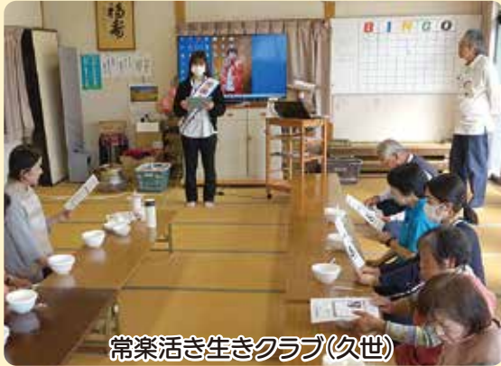
常楽活き生きクラブ(久世)