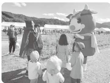
コスモス祭り(北房)