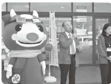
共同募金オープニングイベント(久世)