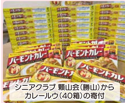
シニアクラブ 頼山会(勝山)から カレールウ(40箱)の寄付