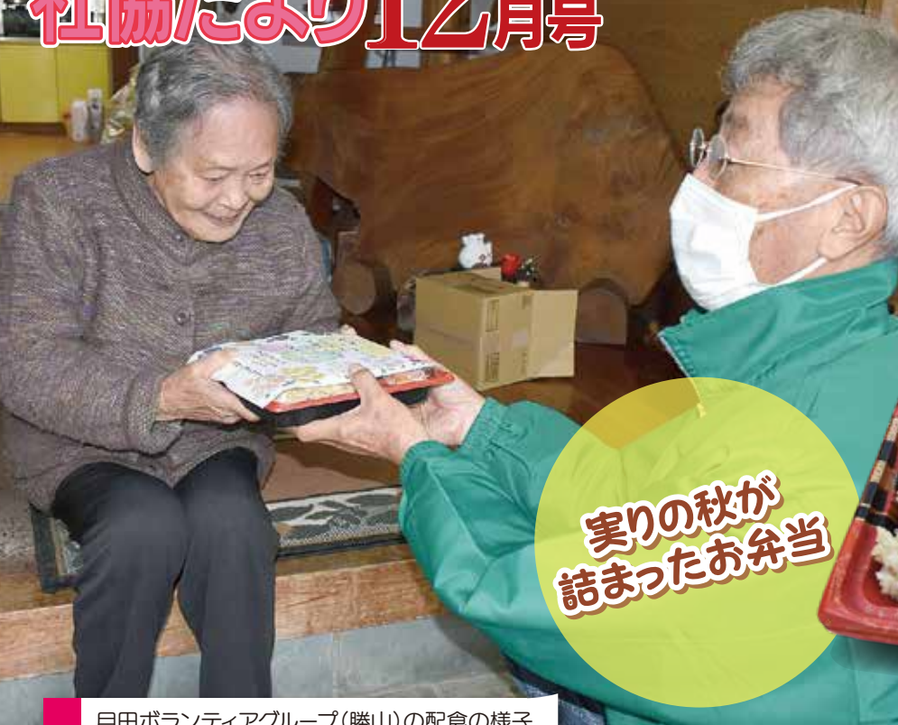
月田ボランティアグループ(勝山)の配食の様子