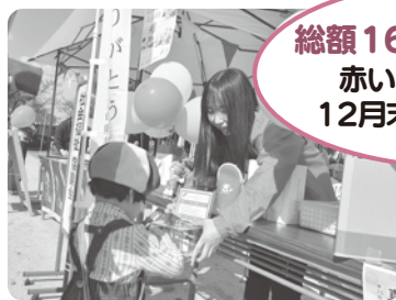
ひとさじのシアワセ展(久世)