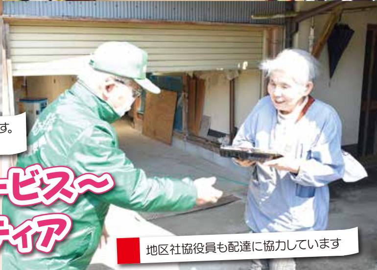
地区社協役員も配達に協力しています