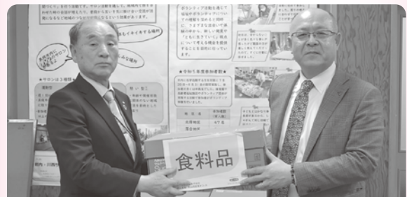
企業からのご協力も増えています (写真は第一生命(株)津山西営業オフィス様寄贈時)