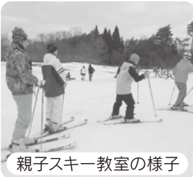
親子スキー教室の様子