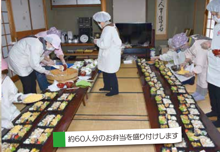
約60人分のお弁当を盛り付けします