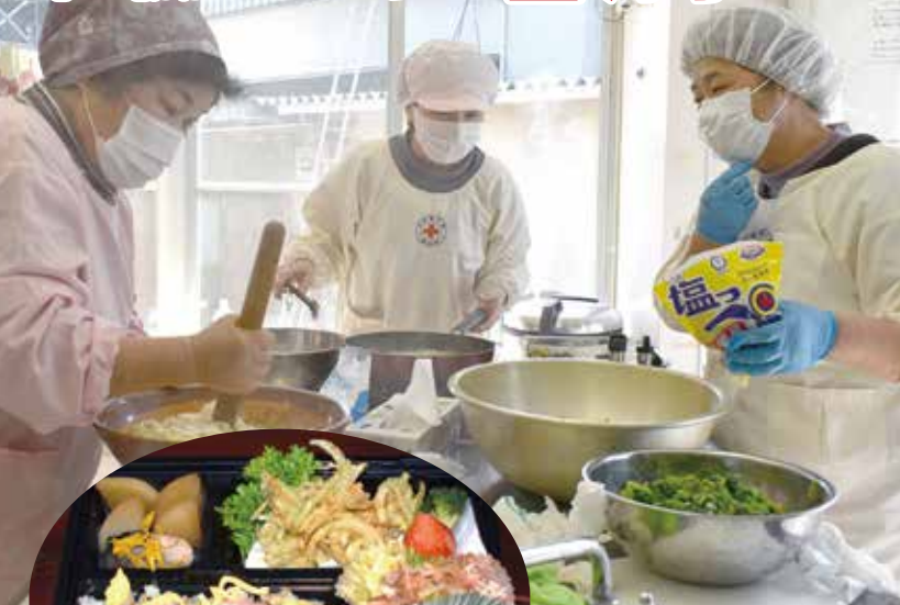
季節にあわせたメニューを作ります。 3月はちらし寿司♪