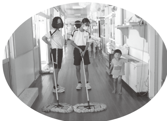
活動中の様子（八束こども園）