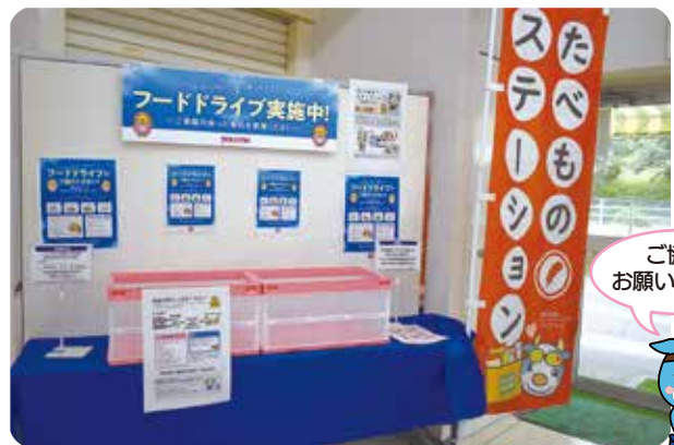
社協窓口でも受付けています。

値上がりが続き、生活費のきびしい時に利用しました。食べる物は生活に欠かせないので助かりました。