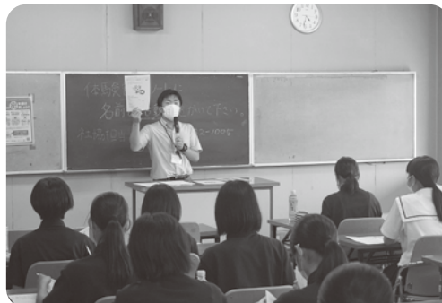
昨年の事前研修の様子（久世）

参加者はボランティア活動の詳しい流れ等の説明を受けます。 また、受け入れ施設と参加者が活動の注意事項、活動日、活動内容について確認をします。