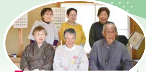
最高齢は93歳!皆さんお元気で

また、真庭市地域包括支援センターの清水理学療法士による体組成計・運動機能分析装置を用いた全身の筋肉量、筋質点数などの測定が行われました。