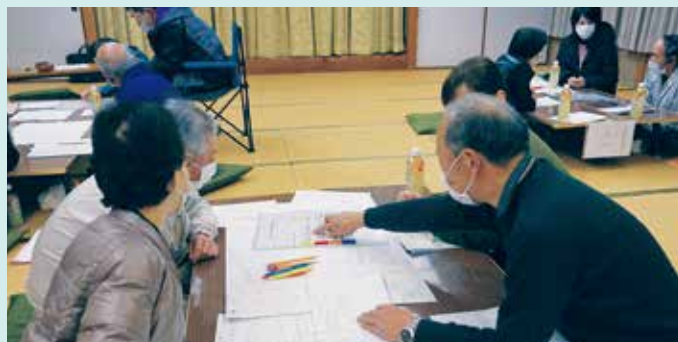
宮芝・町西福祉の会 助けあい会議(久世)