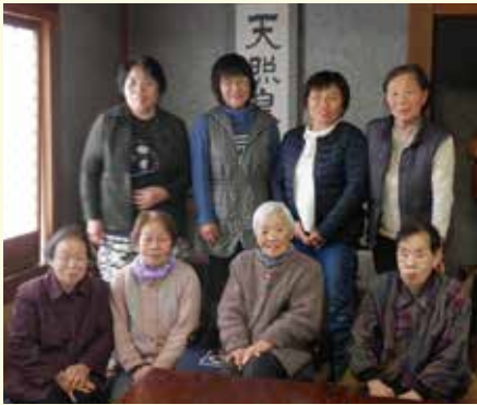
地域のつながりを大切にしたい!

役を担っている自分たちが後期高齢者になり、「みんなの顔が見えるけんええわ」と言ってくれる参加者のためにサロンを続けていくには、若い人に世代交代をしていく必要があると思うからです。