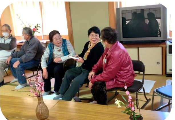
西谷ふれあいサロン（北房）：楽しくおしゃべり