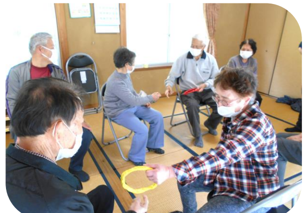
二ツ木サロンまんさく(勝山): みんなでゲーム