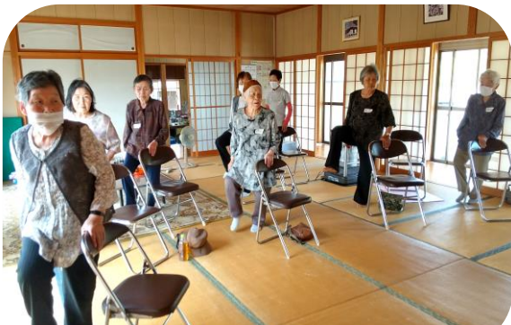
徳山なかよし会（川上）：体操に取り組んで介護予防