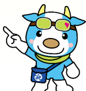
社協の「きょうちゃん」